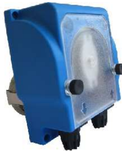
SPECIAL: OPEN CASE > IPS6